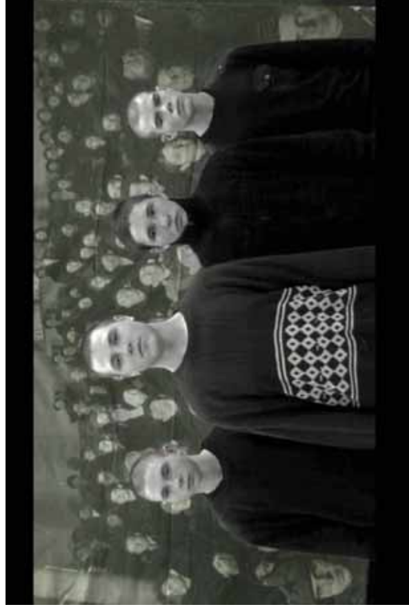
У каждого был свой спаситель... (из «Блокадной книги» Алеся Адамовича и Даниила Гранина)

Один из последних проектов Канской ВК и Юридического института СФУ имел патриотическую направленность. Об этом проекте рассказывается на официальном сайте Юридического института СФУ.