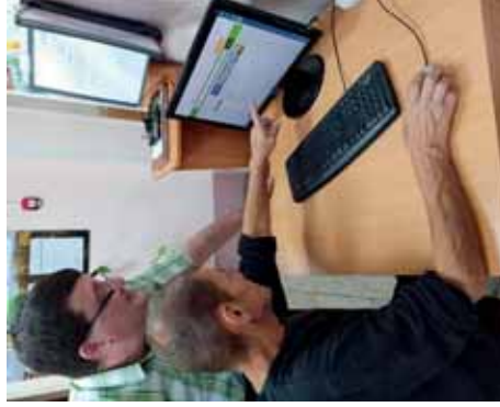
Специалист Центра адаптации помогает получателю услуг в поиске работы.

В комплексе проводимая специалистами Центра работа помогают бывшим осужденным найти свое место в жизни, а любой пример успешной адаптации вдохновляет коллектив на дальнейшую работу в решении жизненно важных вопросов получателей услуг.